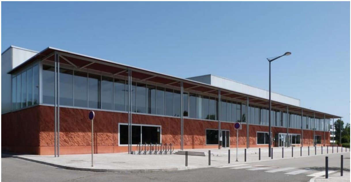
Complexe sportif des Rives de la Thur