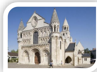
Notre Dame le Grande

Poitiers constitue le chef-lieu du département de la Vienne. Cette ville est aussi la capitale régionale du Poitou-Charentes. Cette position régionale importante fut permise par une importante empreinte historique. En guise d'exemple, nous pouvons citer Sainte Radegonde qui créa à Poitiers au VI ème la première abbaye française exclusivement féminine. Par ailleurs la ville est nommée « ville aux cent clochers » pour ses nombreuses églises. Nous vous invitons à prendre du plaisir et à flâner dans les rues et ruelles du vieux Poitiers où vous attendent de nombreuses surprises architecturales et historiques.