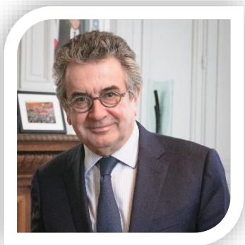
Alain CLAEYS Président de Grand Poitiers Maire de Poitiers

Je tiens à remercier chaleureusement les accompagnateurs, bénévoles et arbitres qui vont contribuer à faire de cette journée un moment inoubliable pour les 200 sportifs de toute la France. Que chacun prenne du plaisir et que les meilleurs gagnent.