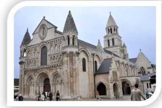
Notre Dame le Grande

Poitiers constitue le chef-lieu du département de la Vienne. Cette ville est aussi la capitale régionale du Poitou-Charentes. Cette position régionale importante fut permise par une importante empreinte historique. En guise d'exemple, nous pouvons citer Sainte Radegonde qui créa à Poitiers au VI ème la première abbaye française exclusivement féminine. Par ailleurs la ville est nommée « ville aux cent clochers » pour ses nombreuses églises. Nous vous invitons à prendre du plaisir et à flâner dans les rues et ruelles du vieux Poitiers où vous attendent de nombreuses surprises architecturales et historiques.