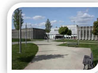
Campus de Poitiers

Pour terminer, cette capitale régionale accueille depuis 1431 de nombreux universitaires. Les plus brillants sont René Descartes ou encore François Rabelais. Concernant l'attrait de la ville de Poitiers pour son université, nous pouvons dire que celui-ci est grand. Cela en est même devenu une tradition : Poitiers a su préserver et faire fructifier son pôle universitaire puisqu'elle est actuellement la ville ayant la plus grande proportion d'étudiants comparée à la population totale.