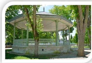
Le Parc Blossac

En revanche, si l'Histoire n'est pas votre passion, pas de soucis ! Nous pourrions croire avec que la ville de Poitiers est ancrée dans son passé reconnu, mais Poitiers n'est pas le cas. Ville dynamique, Poitiers abrite de nombreuses infrastructures comme la Médiathèque, le Confort Moderne, le Parc des Expositions, et la Pépinière entre autres bien entendu. Alors Poitiers, entourée de ses commerces, ses attractions sportives, son coin animalier, ou même ses espaces verts vous offre une large palette de couleurs et d'émotions. Tous ces sites permettent alors un continuel balai d'organisations socio-culturelles.