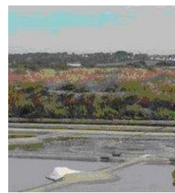
Les marais salants de la Presqu'île Guérandaise