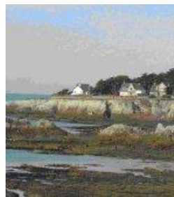
La côte sauvage

La Loire-Atlantique possède plus de 130 km de côtes le long de l'océan Atlantique.