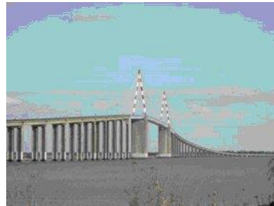
Pont de St Nazaire sur l'estuaire de la Loire

La Loire constitue un élément géographique majeur ; en amont de Nantes, la Loire est encore essentiellement fluviale ; on considère généralement que l'estuaire de la Loire commence au niveau de Nantes et les variations de niveau liées à l'influence océanique des marées y sont perceptibles.