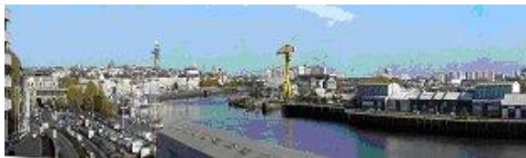
Vue panoramique de Nantes (préfecture de la Loire Atlantique)

Vilaine au Nord, de Maine-et-Loire à l'Est et de Vendée au Sud. La côte Ouest est bordée par l'océan Atlantique. Le département est traversé par la Loire, qui se jette dans l'océan au niveau de Saint-Nazaire.