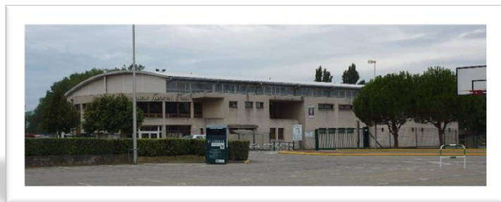
Gymnase Joseph Plat