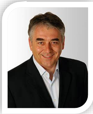
Gilles BOURDOULEIX Maire de Cholet Président de Cholet Agglomération Député honoraire

Je souhaite bonne chance à tous les athlètes. Que chacun profite pleinement de ces championnats de France dans le Choletais.