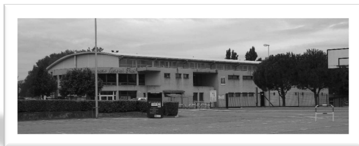
Gymnase Joseph Plat